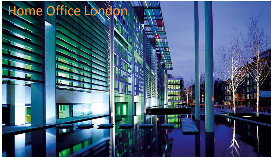
Home Office London