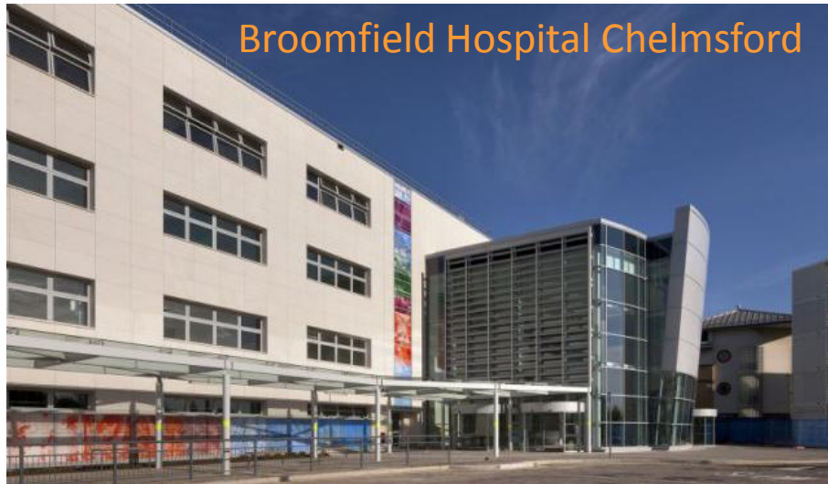
Broomfield Hospital Chelmsford