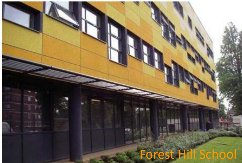
Forest Hill School