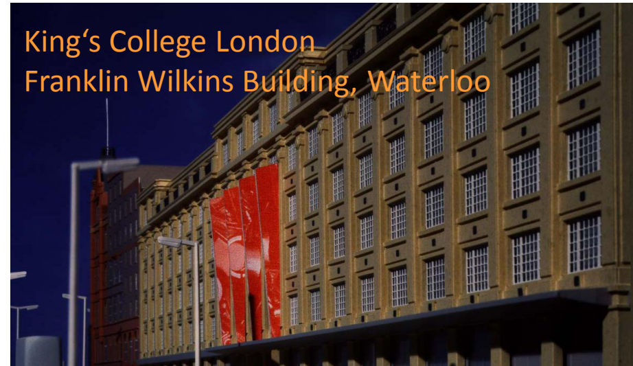
King's College London Franklin Wilkins Building, Waterloo