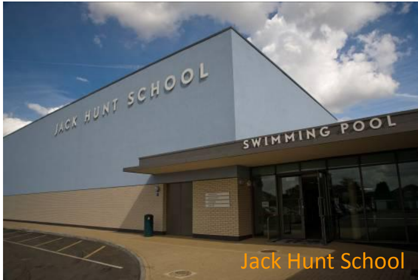
Jack Hunt School